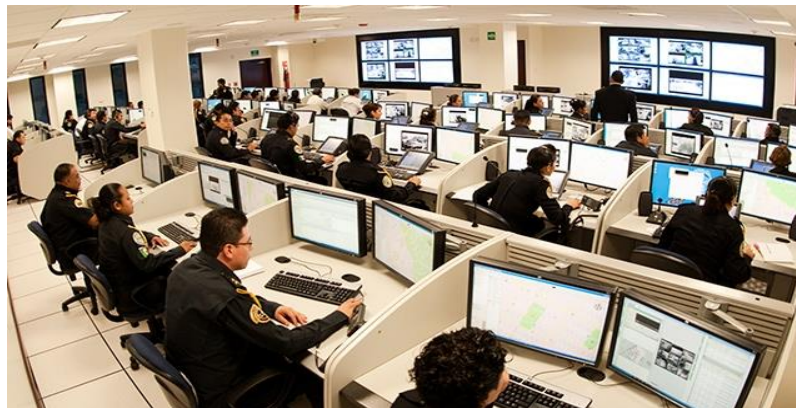
UNIDADES DE CONTROL Y COMANDO C3 C4 C5