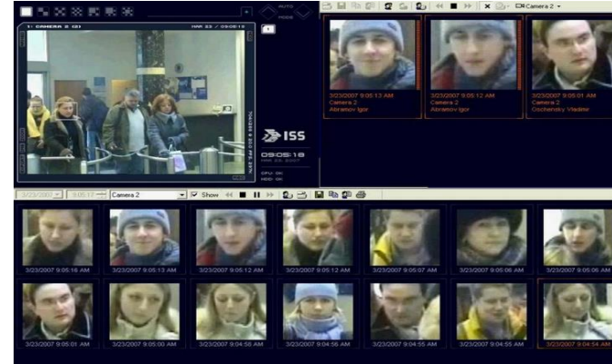
BUSQUEDA DE ROSTRO