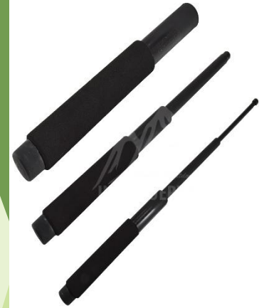
EQUIPO DE INTERVENCION