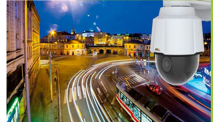
ZOOM OPTICO POTENTE