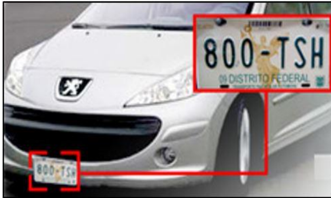
RECONOCIMIENTO DE PLACAS